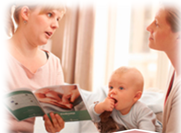
Kind en Gezin, CLB etc.